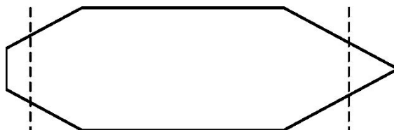
ON DECK SPACES