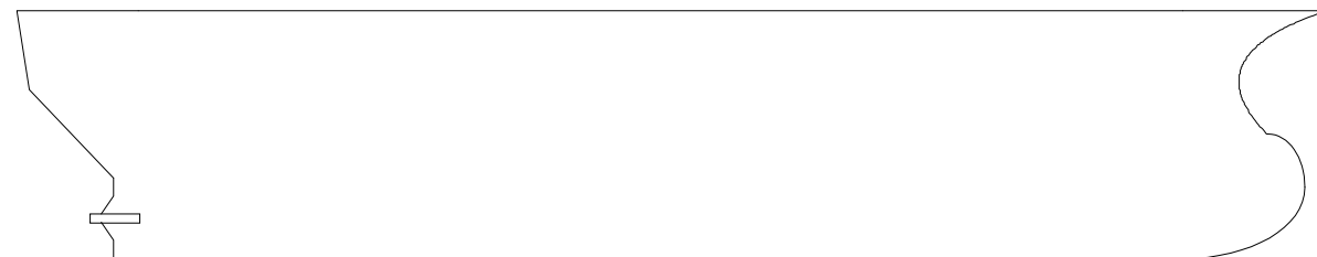
Locali sotto il ponte / Underdeck spaces