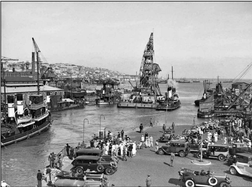
Lisbona. La zona portuale.