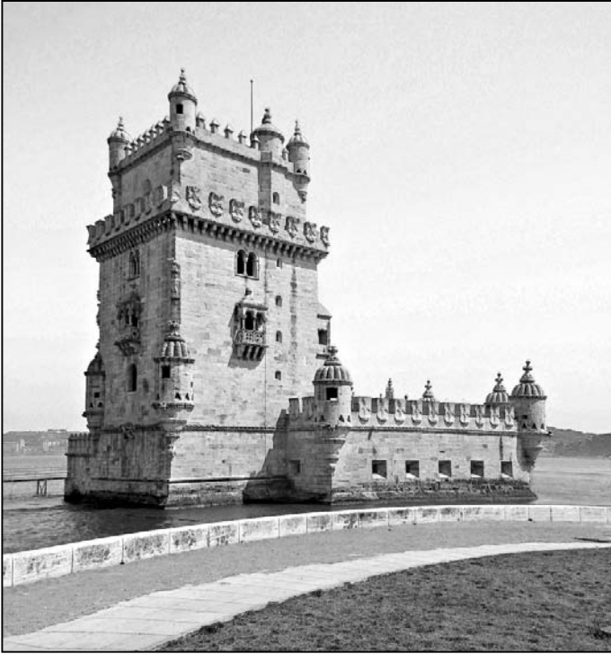
La torre di Belém.