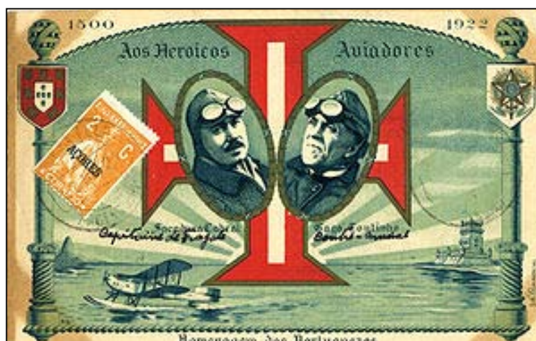
Coutinho e Sacadura Cabral, i due grandi aviatori portoghesi.