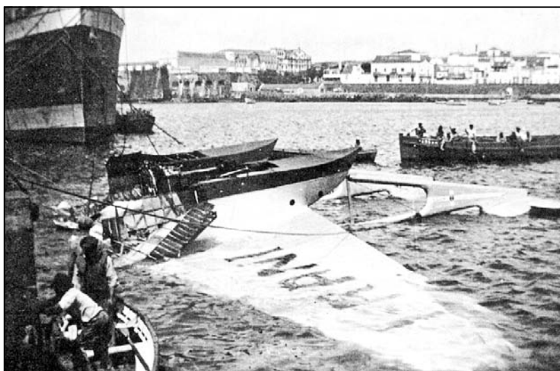
L'IRANI, ormai ridotto a rottame.