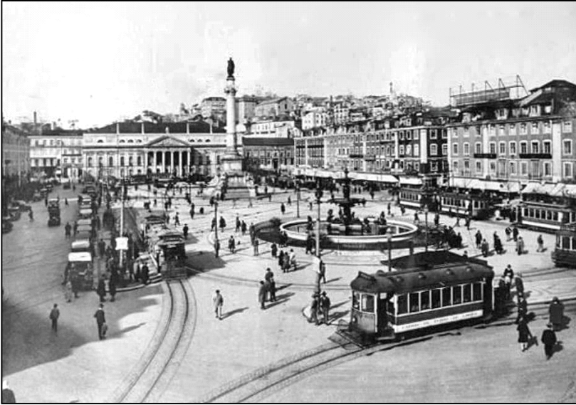
Il “Rossio”, la piazza principale di Lisbona negli anni '30.